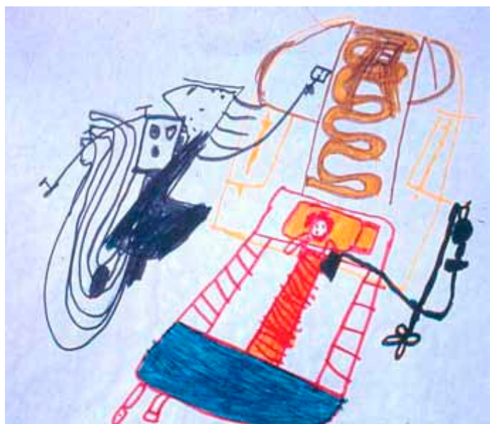
Barnets eget billede på en undersøgelse eller indlæggelse.