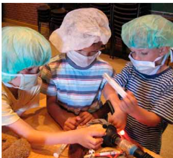
Børn leger hospital, og det hjælper dem til at forstå undersøgelser bedre. Fra www.boernpaahospital.dk .

På radiograf.dk har vi også så småt taget undersøgelser af børn op, som en selvstændig emneside om alle aspekter ved undersøgelser af børn.